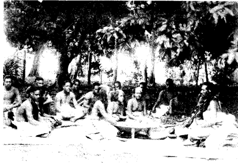
Zubereitung der Kawa, ca. 1898

schen Kolonien im Kaiserreich oder danach jemals wirklich populär gewesen sind. Ihre Verwaltung war ein Luxus, den sich Deutschland nur in einer Zeit zunehmenden ökonomischen Wohlstandes leisten konnte. Die Sehnsucht nach der Ferne mag größere Kreise der deutschen Bevölkerung umfaßt haben, aber Romane, die die deutsche Fernsehnsucht bedienen, spielten zumeist in Amerika. Die deutschen Kolonien gehörten jedenfalls nicht dazu. Wenn man einmal von dem Spezialfall Hans Grimm und dessen „Volk ohne Raum“ absieht, das bezeichnenderweise lange nach dem Ende des deutschen Kolonialreiches entstand und in dem das deutsche Südwestafrika nur als Rahmenhandlung für eine politische Aussage gebraucht wurde, gibt es keinen einzigen erfolgreichen deutschen Roman, der in einer Kolonie spielte. Ebenso bezeichnend ist die geringe Zahl der deutschen Reisenden, die sich eine deutsche Kolonie als Ziel aussuchten. Auch in einer Zeit vor Beginn des Massentourismus waren Reisen in außereuropäische Regionen zwar durchaus nicht ungewöhnlich, Reisen in deutsche Kolonien aber Reisen en passant, Stippvisiten auf dem Wege von oder nach wichtigeren Etappen.