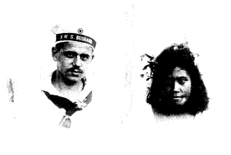
Matrose von S.M.S. „Bussard“ mit Samoanerin