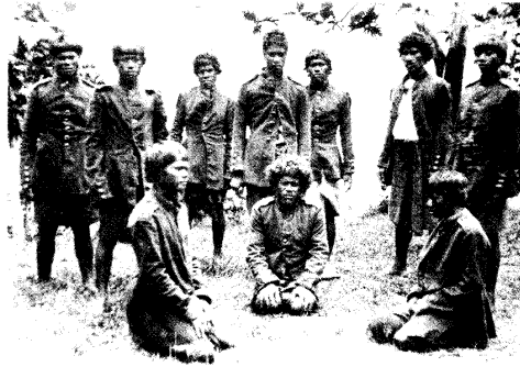
Alte preußische Waffenröcke als Regenröcke für die Arbeiter der Pflanzung Valealili, 1876