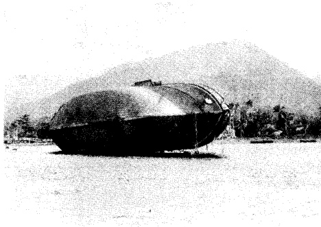
Das Wrack des „Adler“, Apia, ca. 1898

trotz der auf Samoa periodisch aufgetretenen Bürgerkriege in die jede der genannten Mächte in der einen oder anderen Form verwickelt war, noch einmal erneuert. Vorausgegangen war eine Beinahe-Konfrontation, die zu einem Kriegsausbruch zwischen Großbritannien, den Vereinigten Staaten und dem Deutschen Reich hätte führen können. Im berühmten Orkan vom 15. bis 17. März 1889 vor Apia gingen aber keine Kriegsschiffe unter, die sich zuvor schuß- und kampfbereit gegenüberstanden hatten. Ehlers beschreibt den im Hafengebiet von Apia vor sich hin rottenden Rumpf des deutschen Kriegsschiffes „Adler“, das damals untergegangen war. Dieser fast als „Wahrzeichen“ des Hafens in Apia verbliebene Rumpf wurde erst Jahrzehnte nach Ende des Zweiten Weltkriegs beseitigt; das Erinnerungsdenkmal an die im Wirbelsturm umgekommenen deutschen Matrosen 14 steht noch heute und ist ein beliebtes Fotomotiv deutscher Samoatouristen.