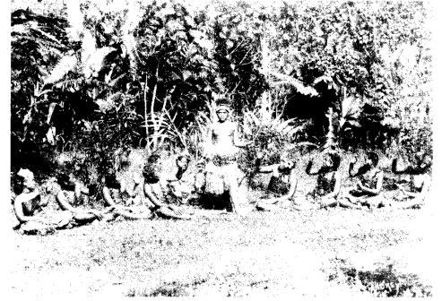
Siwatanz. Apia, ca. 1898

Da scheint es kein Zufall, daß auch der spätere Munizipalitätspräsident von Apia und erste deutsche Gouverneur von Samoa, Wilhelm Solf, vor seiner Ausreise nach Samoa „die Perle der Südsee“ zu Rate zog. Daß Ehlers Solf in vielem beeinflusst haben muß, wird aus der Tätigkeit des ersten deutschen Gouverneurs ersichtlich. Ehlers verabscheute die europäischen Siedler und Händler – eine Haltung, die Solf nur zu sehr teilte. Ehlers kritisierte den „europäisierten“, nicht-traditionellen Samoaner – Solf unternahm als Gouverneur alles, um die traditionelle Lebensweise der Samoaner zu erhalten. Ehlers berichtet von der Forderung Tamaseses, die Samoaner von der Arbeit bei Europäern zu befreien – Solf hat diese von der samoanischen Oligarchie an ihn herangetragene „Bitte“ schließlich genehmigt. Als notwendige Arbeiter für die deutschen Pflanzungen empfahl Ehlers Japaner –