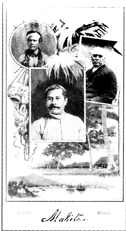
Frontispiz der „Samoa“ Ausgabe von 1895

„Das erste Buch, welches ich vor vielen Jahren, als ich noch nicht wissen konnte, daß ich nach Samoa kommen würde, gelesen habe, war das Buch von Ehlers: ‚Samoa, die Perle der Südsee‘, und ich kann Ihnen versichern, daß Samoa tatsächlich die Perle der Südsee ist, und ich würde dem hohen Hause in meinem Namen und im Namen meiner braunen Schutzbefohlenen sehr dankbar sein, wenn Sie bei der Fassung dieser Perle nicht zu viel am Golde sparten.“